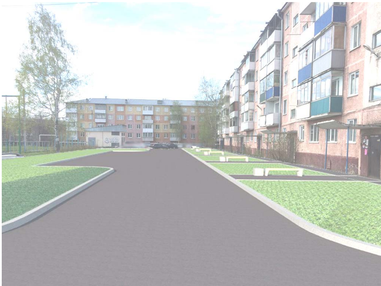
Рис. 3 – Вид на благоустраиваемую территорию.