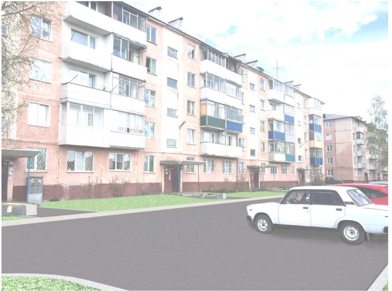
Рис. 4 – Вид на благоустраиваемую территорию.