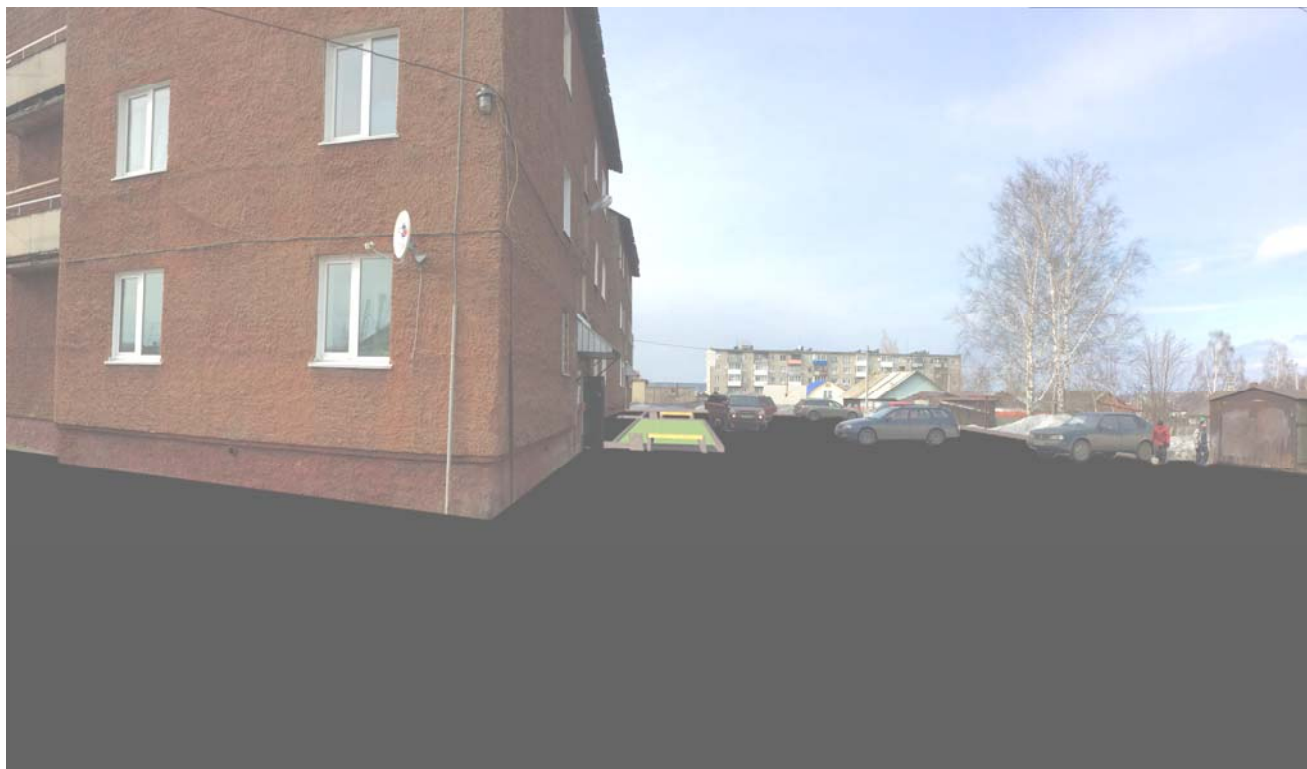
Рис. 3 – Вид на благоустраиваемую территорию.