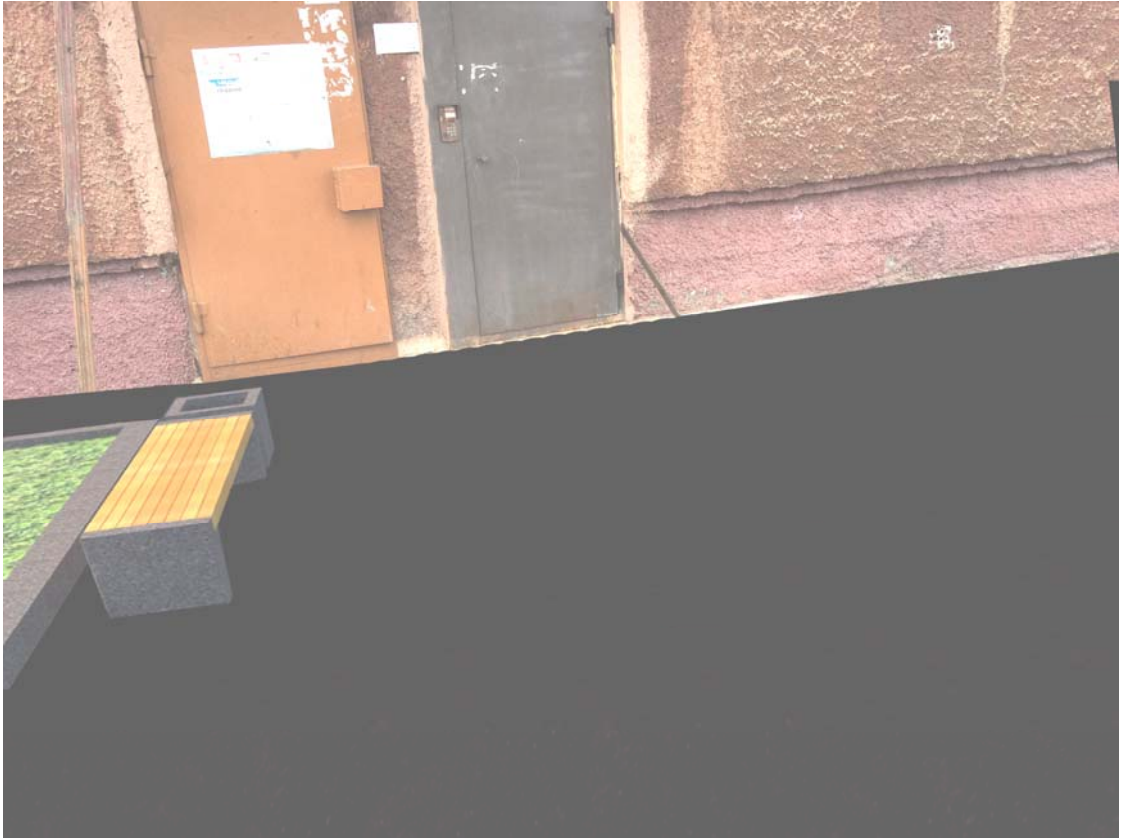
Рис. 4 – Вид на благоустраиваемую территорию.