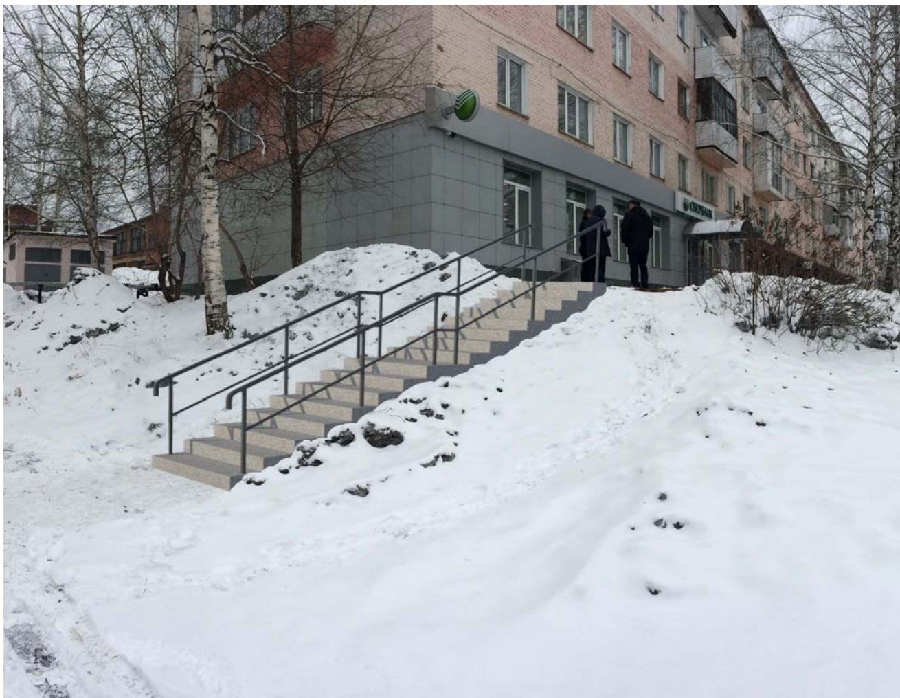
Рис. 1 – Вид на благоустраиваемую территорию.

На благоустраиваемой территории планируется размещение пешеходной лестницы, состоящей из двух железобетонных лестничных пролетов по 8 ступеней, соединенных в одну лестницу; металлические окрашенные перилла с двух сторон лестницы.