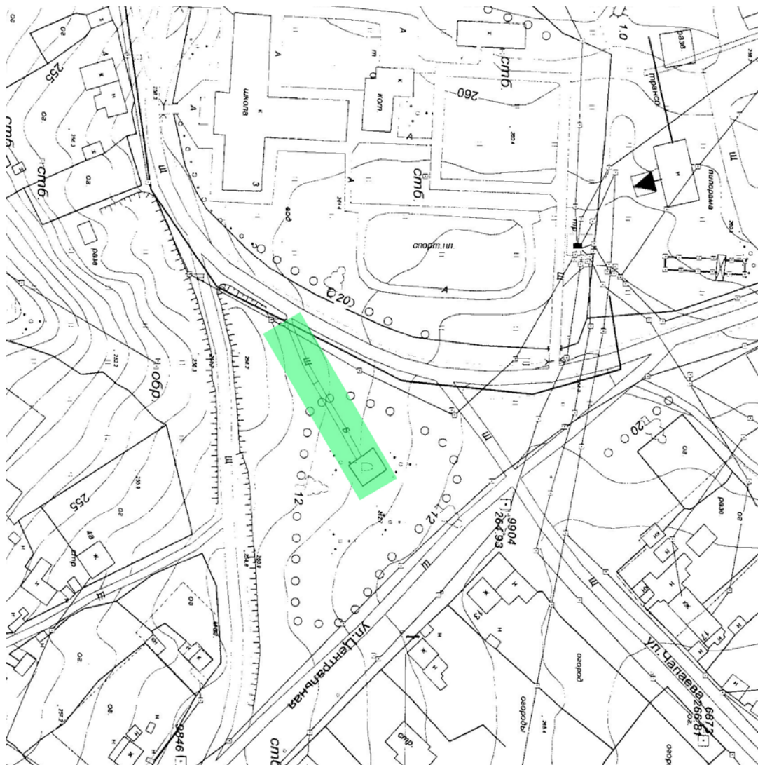
Рис. 2 – Схема расположения границ земельного участка объекта «Сквер памяти»

На территории частично разрушено покрытие тротуара. Требуется установка бортовых камней. Так же на территории не предусмотрены зоны для размещения скамей и урн.