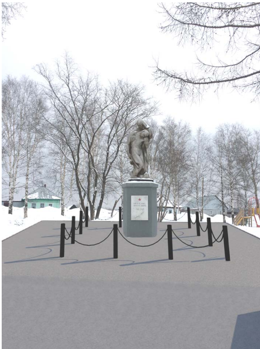
Рис. 4 – Вид на благоустраиваемую территорию.