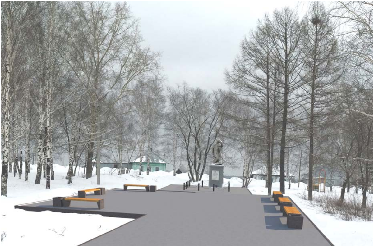
Рис. 3 – Вид на благоустраиваемую территорию.