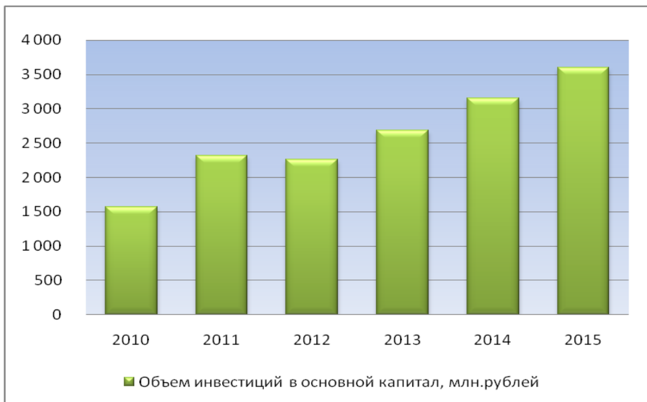
Рис.1. Прогноз роста объема инвестиций в основной капитал до 2015 года.

Цели управления предполагают создание условий как для повышения эффективности использования имеющегося потенциала города, так и для планирования и формирования потенциала города, адекватного будущим потребностям жителей города и способного обеспечить выполнение миссии. На основании целей и задач определены прогнозные значения показателей социально-экономического развития города в краткосрочной и долгосрочной перспективе.