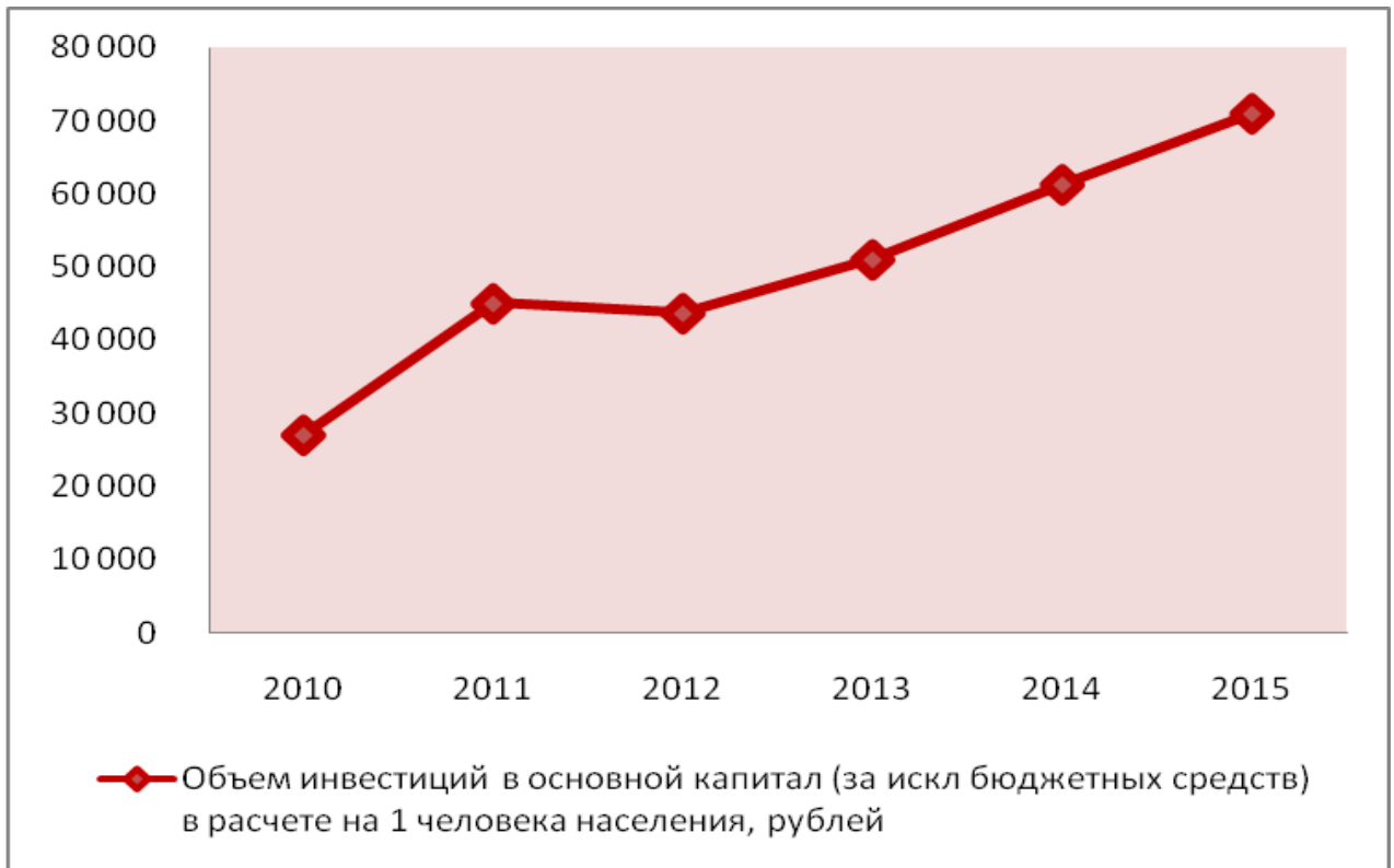
Рис.2. Прогноз роста объема инвестиций в основной капитал (за исключением бюджетных средств) в расчете на 1 человека населения до 2015 года.